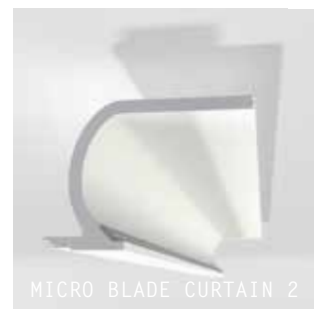
MICRO BLADE CURTAIN 2

LEDs et accessoires sur sedap.com / LEDs and accessories at sedap.com