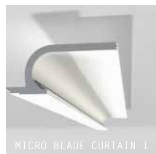
MICRO BLADE CURTAIN 1