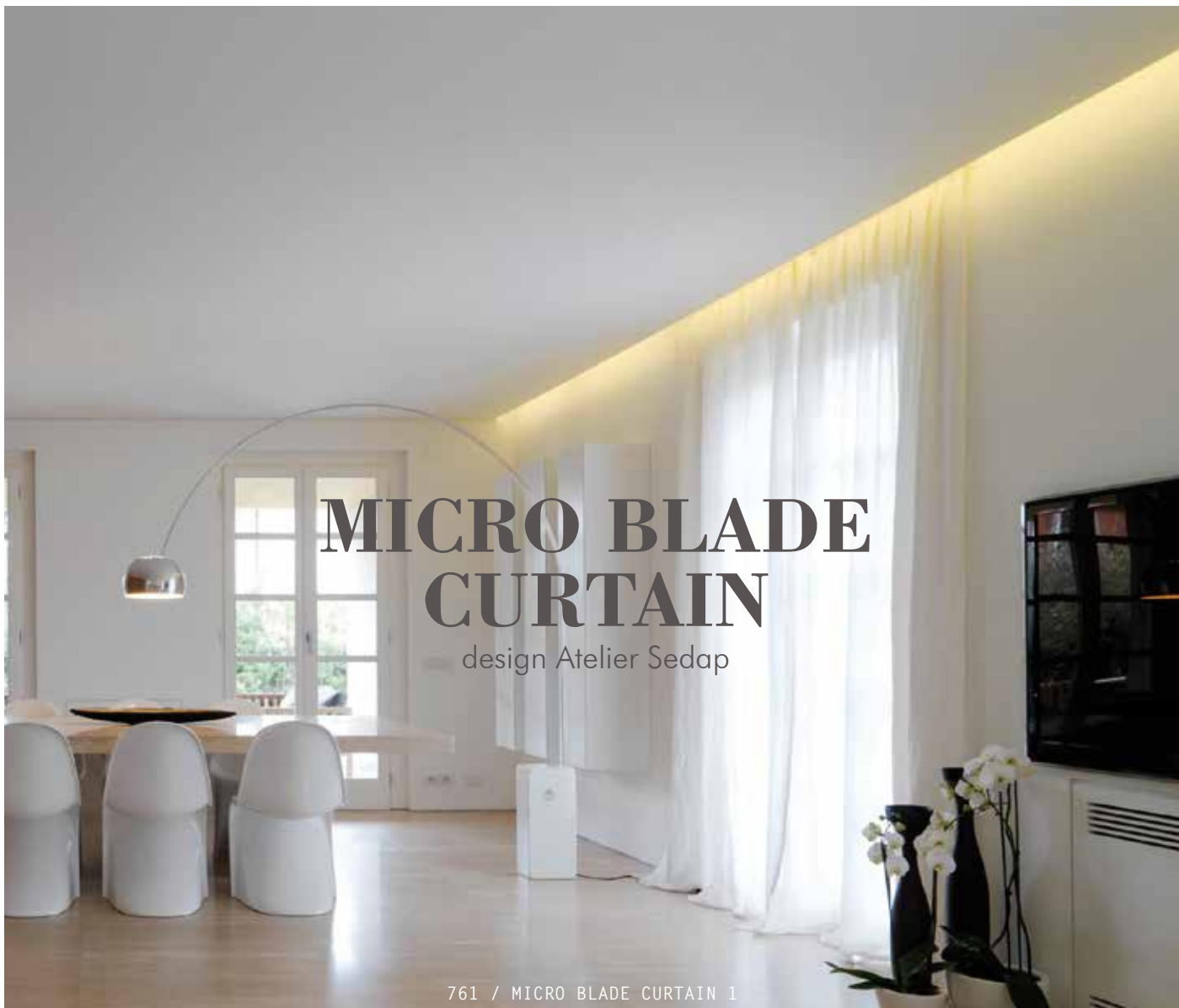
761 / MICRO BLADE CURTAIN 1

Profil en plâtre HD à encaster pour intégration de sources LEDs dans plafond et mur. Micro blade est un système spécialement adapté aux cloisons en plaques de plâtre.