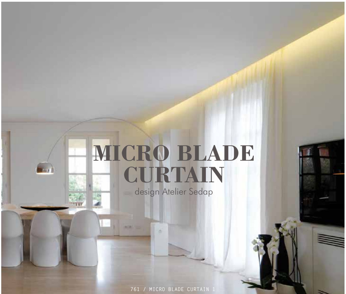
761 / MICRO BLADE CURTAIN 1

Profil en plâtre HD à encaster pour intégration de sources LEDs dans plafond et mur. Micro blade est un système spécialement adapté aux cloisons en plaques de plâtre.