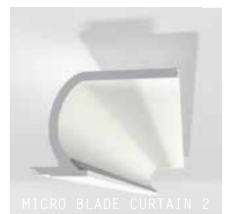
MICRO BLADE CURTAIN 2

LEDs et accessoires sur sedap.com / LEDs and accessories at sedap.com