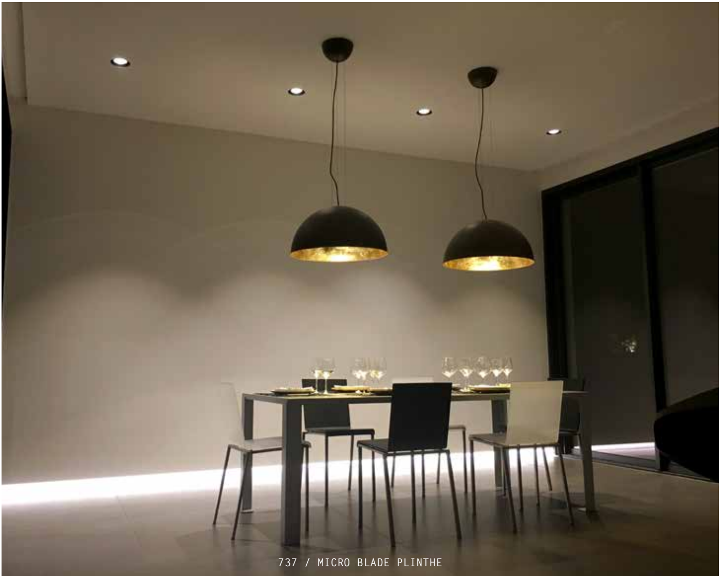
737 / MICRO BLADE PLINTHE

Profil en plâtre HD à encastrer pour intégration de sources LED dans mur. Fixation de l'équipement par aimants. Micro Blade is a high strength plaster profile for recessing linear LED lighting, 56 mm deep, especially designed for walls. Equipment installation with magnets.